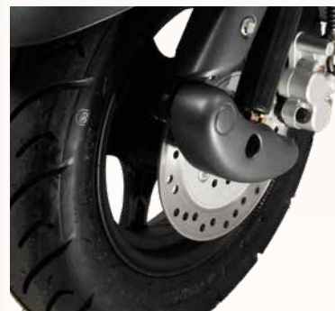
krachtige remschijf met zwarte "halve maan"

De Retro is er ook als Black Edition en kenmerkt zich door een stoere uitstraling. De gekleurde kapdelen gecombineerd met glanzend zwarte accenten waaronder het stuur, de spiegels en de koplamp maken van deze Retro een ware eyecatcher.