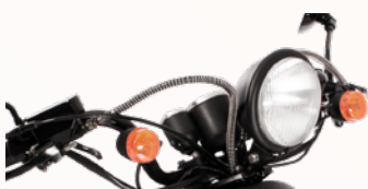
het bekende retro stuur met zwarte koplamp