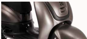
klassieke retro lijn met zwarte accenten

De Retro is er ook als Black Edition en kenmerkt zich door een stoere uitstraling. De gekleurde kapdelen gecombineerd met glanzend zwarte accenten waaronder het stuur, de spiegels en de koplamp maken van deze Retro een ware eyecatcher.