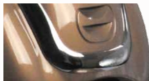
opvallende voorkap met chromen decoratie

Met zijn brede chromen stuur en grote chromen koplamp geniet de Retro enorme populariteit. Door de klassieke kleuren is er voor iedereen een passende Retro beschikbaar.