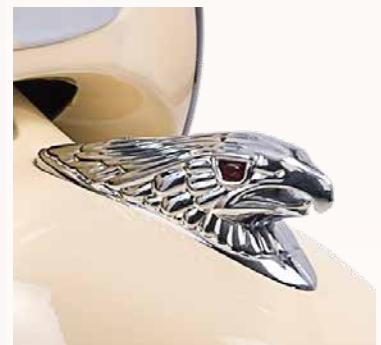
de opvallende adelaar

De Retro Pimpstyle Plus is werkelijk voorzien van alle stijlelementen. Op de Retro Pimpstyle Plus vind je onder andere chromen sierbeugels, adelaar, sierstrip, chromen carterdeksel en op de koplamp een chromen wimper.