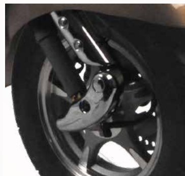
swingarmvering voor comfortabele ritten